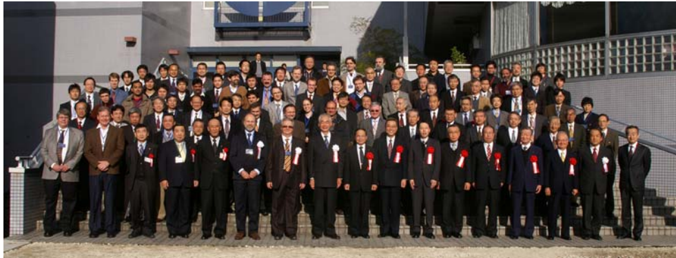
会議参加者集合写真

第18回国際土岐コンファレンス（ITC18）を岐阜県土岐市のセラトピア土岐において12月9日（火）から12日（金）の4日間の日程で開催しました。国際土岐コンファレンスは毎年、核融合科学研究所が主催し土岐市で開催している核融合に関する国際会議です。プラズマ物理及び核融合関連技術に関する実験、理論及び開発研究の最近のめざましい進展、とりわけLHDにおける研究の進展は、ヘリカル型核融合実証炉実現に向けた道筋をあきらかに示すものと期待されており、本国際会議のタイトルとして“Development of Physics and Technology of Stellarators/Heliotrons en route to DEMO”（DEMO炉に向けたステラレーター／ヘリオトロンの物理と工学の進展）を掲げました。本国際会議では、ヘリカル型核融合実証炉実現を目指した課題の議論を行うため、最近の大型実験プロジェクトのレビューをはじめ、プラズマ閉じ込め物理に関する実験と理論、定常運転に関する実験や工学技術、プラズマ加熱や燃料供給法、マグネットなどの関連工学技術、先進プラズマ計測、炉設計や新しい炉概念、基礎プラズマ研究等に関して、理論、実験、工学開発研究の最新の研究成果が報告され、議論に供されました。