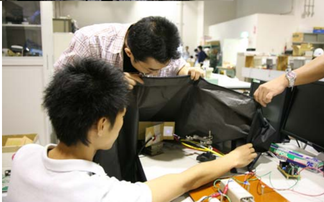
写真2： 実習風景(左上；サイクロトロン加熱アンテナの調整、右上；高温超伝導コイルの作成、左；ヘリウムプラズマの生成)