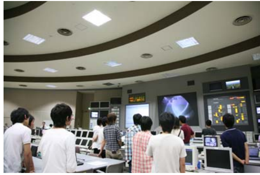
写真4：最先端の研究設備を間近で見学