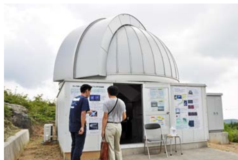
【文責 国立天文台 岡山天体物理観測所】