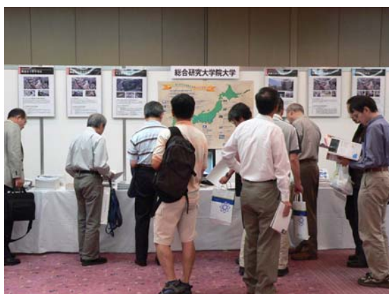
大学紹介展示ブース

シンポジウム会場では講演会場の他にパネル展示のブースもあり、総研大の他、自然科学研究機構、分子科学研究所、国立天文台、核融合科学研究所、基礎生物学研究所、生理学研究所の各機関が趣向を凝らして展示し、研究活動をPRしていました。多くの参加者の方が、展示ブースを訪れ資料を手に取り、担当者に質問するなど、こちらも盛況のうちに終了しました。