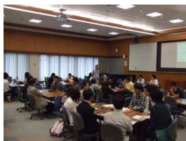
【文責 天文科学専攻 博士後期課程3年 貴島政親】