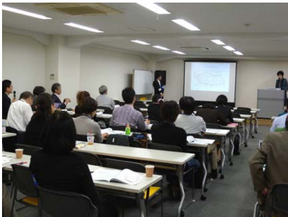
院生による口頭発表