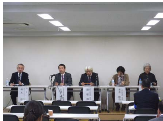
シンポジウム（パネルディスカッション）