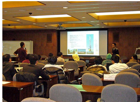
参加者発表会での質疑応答

参加者の多くが初めての来日で、本人はもとより参加をサポートする運営事務方も大変だったと思います。参加者にとって、専攻にとって、総研大にとって、アジアの宇宙科学にとって良い影響を残して頂ければ世話人としてこれほどの喜びはありません。興味深い講義をしていただいた講師の皆様、運営関係者、そして旅費援助をいただいた総研大全学教育事業に深くお礼申し上げます。