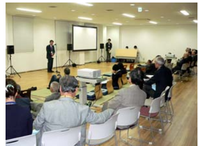
【文責：学融合推進センター】