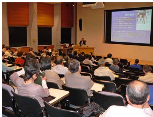
講演会会場の様子