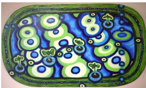
飯田三代 遺伝子の可能性 3.11 以降

昨年度、 Resonance プロジェクトでは、生命共生体進化学専攻の颯田葉子先生（専門：進化学）と5人のアーティスト、基礎生物学専攻の成瀬清先生（専門：生物学）と1人のアーティストが組んで、6作品のアート作品が制作されました。