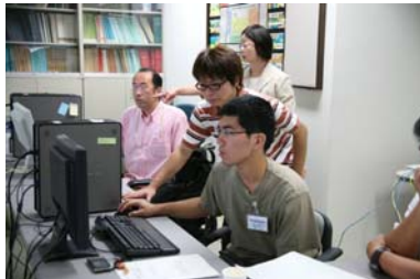
写真4 解析・シミュレーション課題の様子