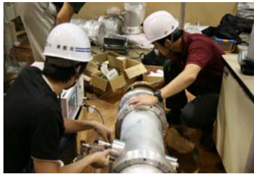
写真3 実験課題の様子