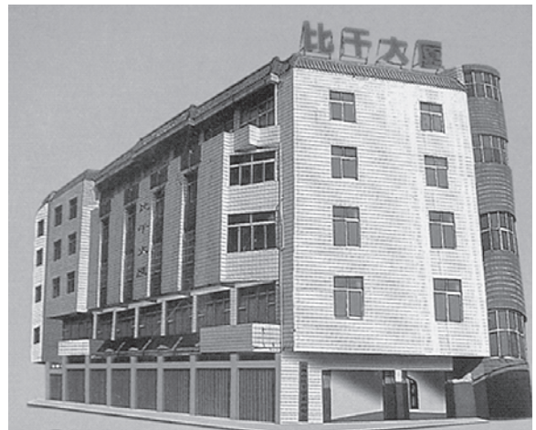
写真1 石獅市林姓宗親会のビル