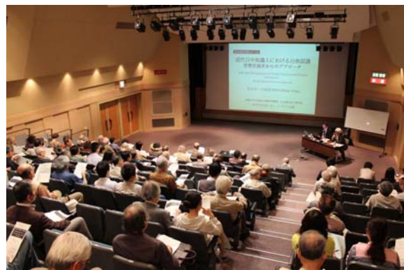
日文研フォーラムの様子