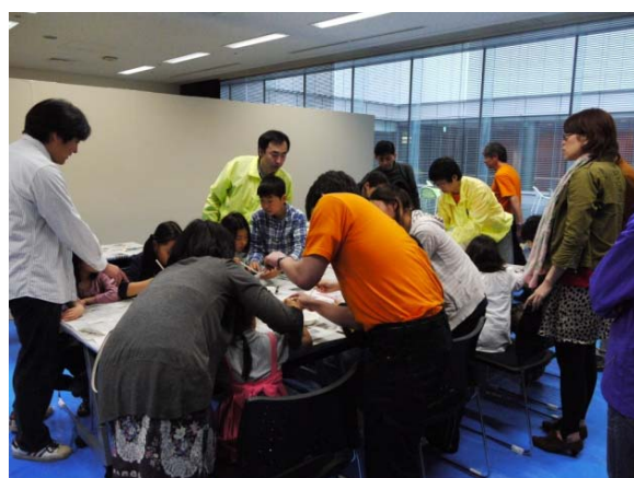
セラミック折り紙の模様