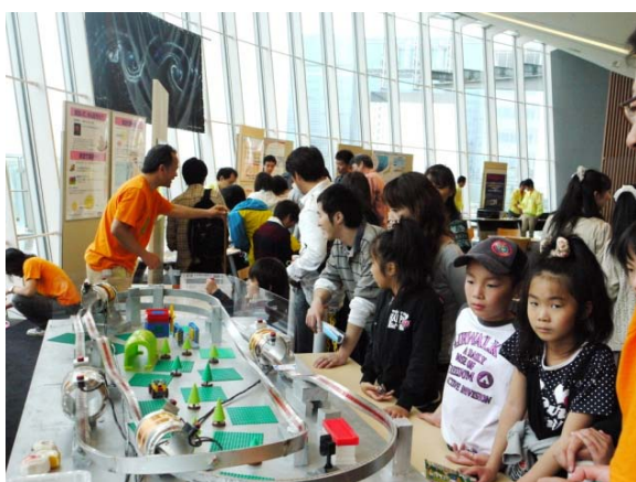
磁気浮上列車の模様

科学教室・展示では、核融合に関連深い技術を利用した巨大プラズマボール、超伝導磁気浮上列車、真空実験、分光、放射線観測などの実演を行いました。線に沿って走るロボット製作とセラミック折り紙体験の科学工作教室は毎回満席となり、親子連れに大変好評でした。また、核融合プラズマの研究に関連したコンピュータシミュレーション技法を用いたプラズマの3次元映像も、多くの方に体験して頂きました。このように科学に親しみながら、核融合の説明パネルにも関心を持っていただくなど、核融合研究について理解を深めていただけました。