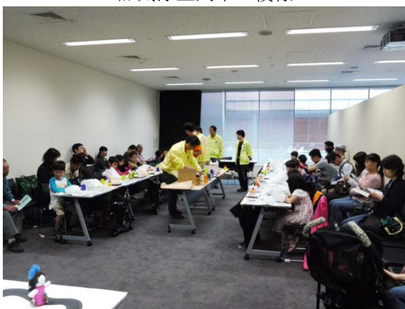
ロボット工作の模様