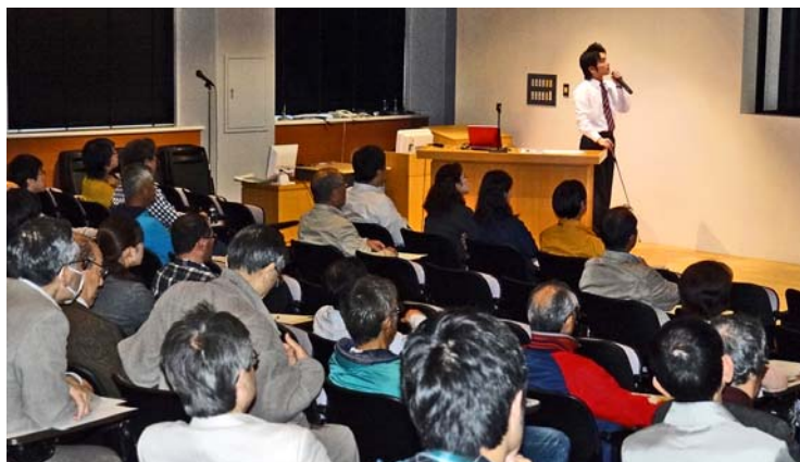
講演会会場の様子