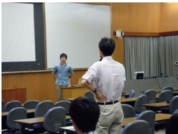
厳しい質問も飛び交います

このプログラムでは、研究内容はサマースチューデントに事前に示され、研究課題を選んで参加申し込みや選考が行われるのですが、学部の実験のように結果が保証されているものではなく、どのような結果が出るかは、指導教員も予測するしかない研究課題も多くあります。試行錯誤で、決して一本道ではない研究という営みに早い機会に実際に触れてもらうことで、将来天文学研究を指向する学生を育ててゆこうという試みは緒に就いたばかりです。指導教員になるとかなりの負担ではありますが、全国の学部の天文学教育のためにも一役買っているという自負を持って取り組んでいます。