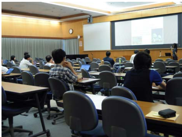
学生も教員も本気の発表会

7名のサマースチューデントは研究するだけでなく9月13日には成果発表会に臨み、一人30分間で、成果を教員、PD、大学院生、サマースチューデントの前で発表しました。写真はいずれも成果発表会の様子です。パワーポイントのアニメーションの機能を使ったりしたわかりやすい説明に努めた発表が印象に残りました。また大学院生にするような本気の質問も飛び交い、盛り上がった発表会になりました。