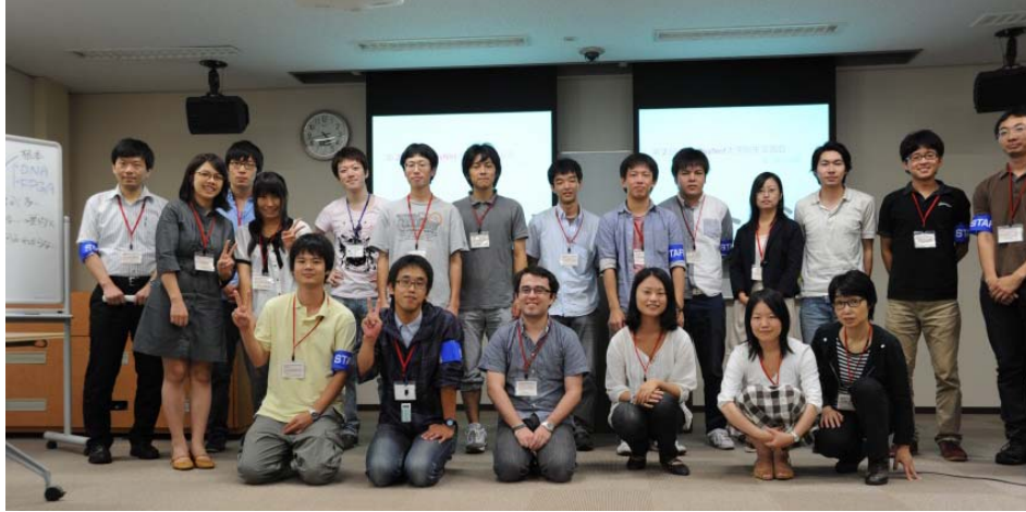
【文責 遺伝学専攻 五年一貫制 2年 鵜之沢英理】