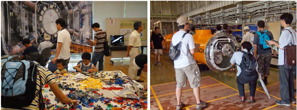
【高エネルギー加速器研究機構 HP より転載】

また、J-PARC(大強度陽子加速器施設：茨城 県東海村)の展示を含め、素粒子原子核研究所、物質構造科学研究所、加速器研究施設、共通基盤研究施設で行われている様々な研究とその成果を紹介する様々な企画を実施しました。例年実施している霧箱教室や科学おもちゃ、素粒子カードゲームコーナーに加え、今年は新たに小林誠杯「理論クイズ王決定戦」も実施するなど、難解になりがちな加速器を使った研究に、親しんで頂けるよう、参加・体験型のイベントの充実を図りました。小さなお子様から大人まで、数多くの方にご参加を頂きました。