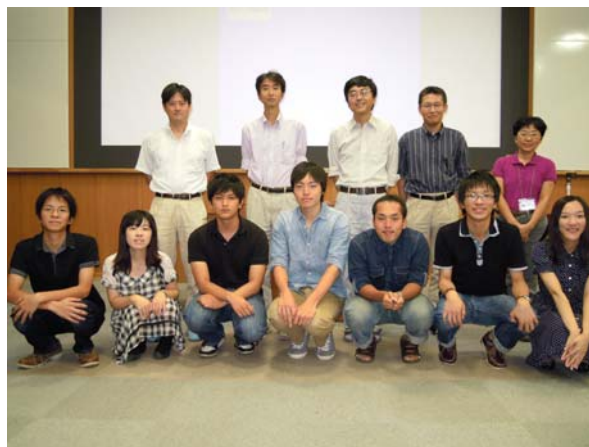
サマースチューデント成果発表会を終えて