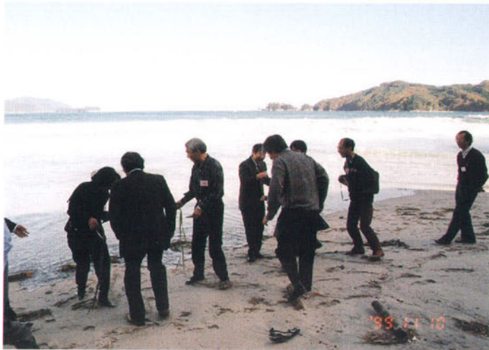
大槌・吉里吉里の浪板海岸でのタチアマモ採集