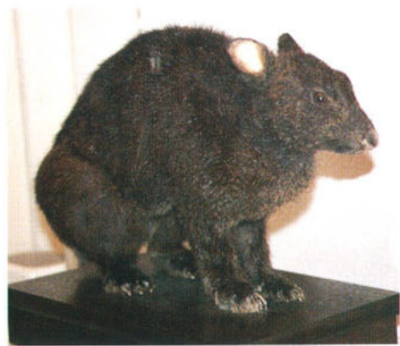
アマミノクロウサギ（剥製：原野農芸博物館）