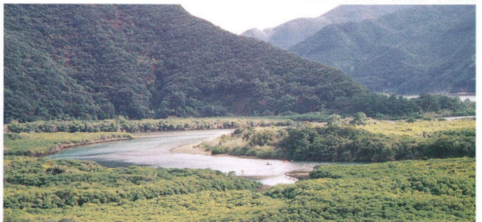
住用川とマングローブの風景

このような限られた範囲ではあるが一貫している環境の中で、循環と共生を考えようというのである。どうやって絶滅動物を守るのか。これを生物学的にやるのではなく、地域社会と野生動物との関係性の中から、実態を把握し、具体的な解決策まで結びつけようとしているのである。つまり「循環と共生」というときの循環とは「水循環」であり、共生とは「地域社会と野生動物の共生」に絞られているわけだ。ことわっておくが、分子屋さんたちもここに参加するのである。