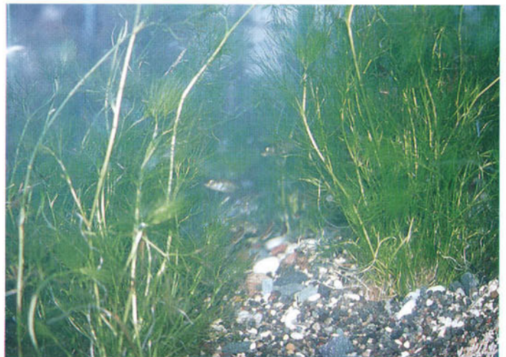
大槌川のイトヨ（水槽）

うな観点からすると、日本の地方の町や村というのがちょうどよい研究対象になってくるんです」