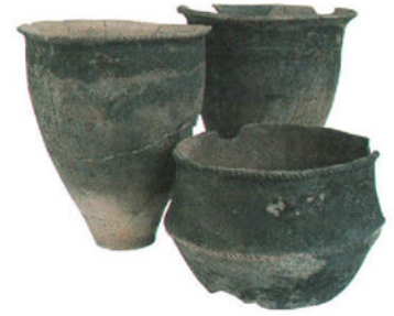
福岡市雀居遺跡の土器。 土器の口縁部からスス混じりのコゲを採取した。

日本列島で水田農耕が本格的に始まったのは九州北部である。その時期は考古学の編年では弥生時代早期とされ、その年代は紀元前4～5世紀とされてきた。ところが、国立歴史民俗博物館（歴博）の最近の研究から、その時期は前9～10世紀になる可能性が高いという結果が出てきた。研究チームの当事者の一人として、その内容を解説する。