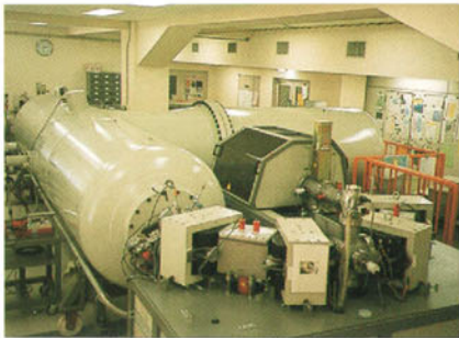
名古屋大学のAMS装置。AMS法による 14 C年代測定法では、現在0.3~0.5%の測定精度が得られる。

のものに付着しているコゲヤス、漆の類は直接土器の使用年代を与えるという利点がある。収集した場所は九州北部を中心に、九州・韓半島南部までの範囲で、おもに共同研究者の藤尾慎一郎・歴博助教授が収集した。その後、収集の範囲を中国・四国・近畿と広げ、また、弥生時代とほぼ重なる時期の東北や信越地方の資料についても収集した。