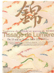
龍村光峯「光の織り」展覧会（パリ日本文化会館）ちらし

総合研究大学院大学教授国際日本研究専攻/人間文化研究機構国際日本文化研究センター教授