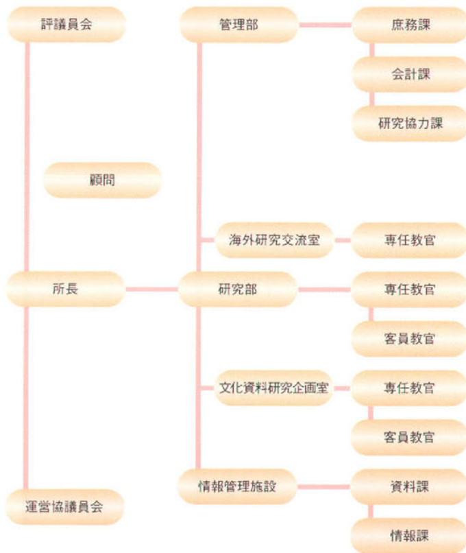
図3 国際日本文化研究センター・組織図(法人化以前：平成15年現在)

横溢にやがて気づく。そのなかで、日本でしか通用しない島国の学問作法を、彼らに強要しようとする態度に潜む、度しがたい鈍感さや密かな傲慢さにも、たまさか合点がゆくようになる。