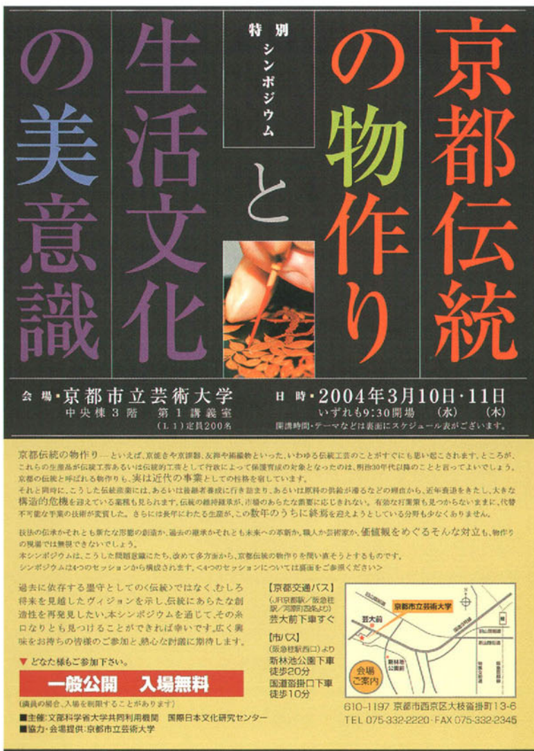
図4 特別シンポジウム「京都伝統の物作りと生活文化の美意識」 2004年3月10日—11日開催のちらし(おもて)

張りを異にする行政の関与も大きく働く。戦後50年のさまざまな施策の歴史を辿るだけでも、保革政権の交替といった地方行政の政治的力学の紆余曲折との関連が、否応なく浮かび上がってくる。