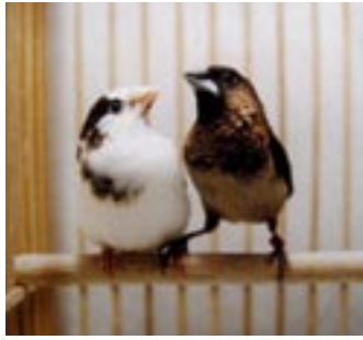
上段:左がジュウシマツ、右がコシジロキンバラ。ジュウシマツは野生のコシジロキンバラをペット化したもの。下段:左はジュウシマツの歌、右はコシジロキンバラの歌。横軸は時間、縦軸は音の高さで示す。ジュウシマツの歌はさまざまな歌要素がいろいろな順番で出てくるが、コシジロキンバラの歌はいつも同じ順番である。