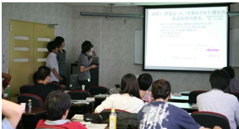
(写真 3) 成果発表会の様子(研究グループ毎に発表)

体験入学の期間中には、上記の研究体験、研究発表以外にもいくつかの催しが行われました。そのひとつは、核融合研の主研究施設である大型ヘリカル装置とスーパーコンピュータ、バーチャルリアリティ(3次元グラフィックによる仮想現実化)装置の見学です。この施設見学は体験入学の初日に行われ、この見学により、最先端の研究施設の一端にまず触れることになります。さらに今回は、専攻長である本島 修 核融合研究所所長による特別講義も行われ、核融合研究の魅力について学ぶ機会が得られたと思います。また、2日目の夕方に夕食を兼ねた懇親会が開かれました。懇親会では、研究を行う上での喜びや悩み、研究以外の楽しみ等についても話し合わせ、体験学生と指導教員、実習補助を行う総研大在学生の間の親睦が深まったようでした。さらに、体験期間中は規則正しい生活リズムを持ってもらうため、毎朝朝礼の時間をとり「体験入学生」が一同に会する機会を設けました。朝礼では「体験入学生」に一人 2-3 分で自己紹介や体験課題の感想を話してもらいましたが、研究テーマが異なる「体験入学生」同士の相互理解が深める良い機会になったようです。