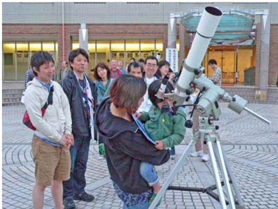
雲の切れ間から土星を見る参加者

当日は、曇りがちで、観望会開催には、必ずしもよい条件ではありませんでしたが、雲の切れ目から「月」や「土星」を観測する事ができました。また国立天文台から来た観望会スタッフが、観測ができない事態に備えて用意していただいた、パワーポイント・データを上映し雲が切れるまでの時間講演を行いました。