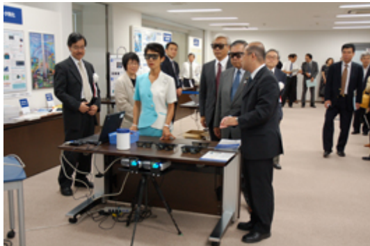
津波データ同化計算の 3D 表示をご覧になる高円宮妃殿下

祝賀会は会場をパレスホテル立川に移して開催され、坂田文部科学事務次官、清水立川市長、西田宇宙科学研究所名誉教授、高畑総合研究大学院大学長から祝辞をいただいたほか、文部科学省泉科学技術・学術政策局長はじめ関係各位、両研究所ゆかりの方など約 420 名にご出席いただき、立川キャンパスでの新たな出発を祝していただきました。