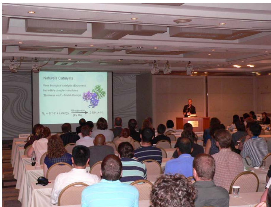
研究成果を報告する若手研究者

JSPS サマー・プログラムで、アメリカ・イギリス・フランス・ドイツ・カナダから来日した113名の若手研究者が、全国各地の受入機関での2ヶ月間の研究活動を終え、8月25日に一堂に会しました。報告会では代表7名による研究成果が報告され、活発な質疑応答が行われました。