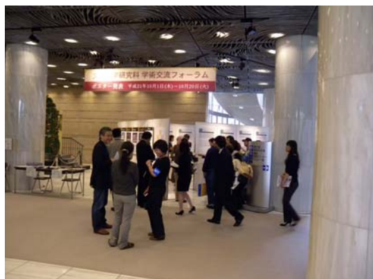
ポスター発表会場