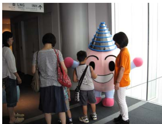
マスコットキャラクタープラズマくんがお出迎え