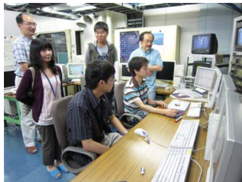
45m 鏡を操作する参加者

ほとんどの参加者にとって電波天文学というのは馴染みがなかったようですが、実際に電波観測を行ってみて、その面白さを理解していただけましたようです。将来、電波天文の道に進みたいと言ってくれた人もいましたので、総研大へ進学してくれる人もいるのではないかと期待しています。