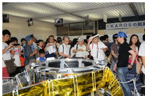
世界初の宇宙ヨット—イカロス

大幅増が予想されたメインキャンパスの来場者数は、初日が 14216 名、2 日目が 19645 名で、合計で 33861 名となり、初日だけで昨年度の 2 日分の来場者数を超えました。相模原の狭いキャンパスに収容できる人数としては限界といえるでしょう。博物館のカプセルの特別展示の方は、初日が 13000 名、2 日目が 17000 名だったとのことですが、聞き取り調査を行うと、待ち行列のあま