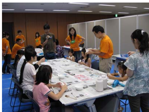
工作教室（セラミック折り紙）