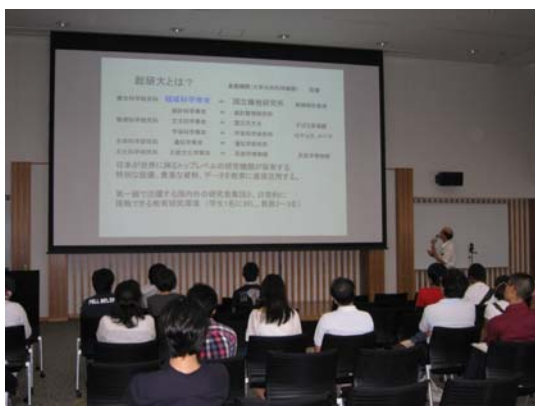
専攻長による総研大概要、極域科学専攻概要説明

また、教員による大学院入学相談や、総研大在生による研究紹介のコーナーが設けられ、約360名の来場者がありました。研究紹介コーナーでは、実際にフィールドワークで利用している道具や、研究成果ポスターの展示、野外調査の情景を撮影したビデオ上映が行われ、来場者からの質問に答える総研大生の姿が印象的でした。