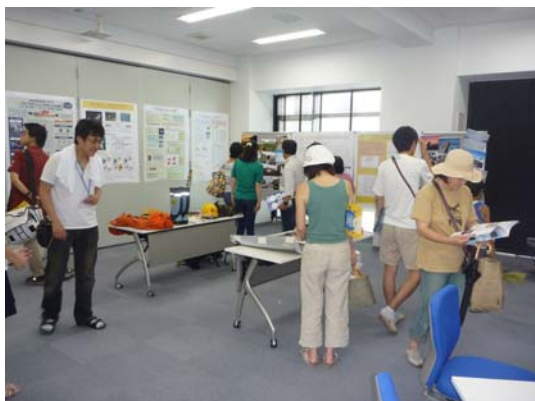
総研大生によるポスター発表等