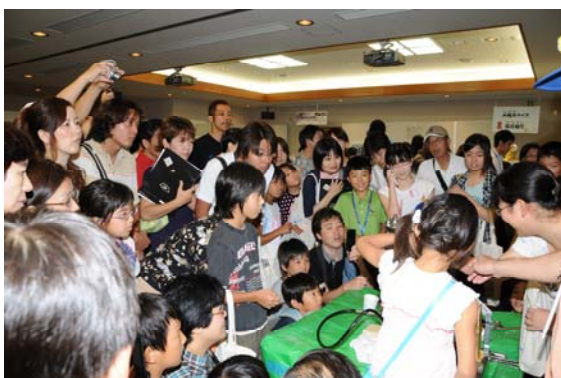
金星大気の 90 気圧を体験