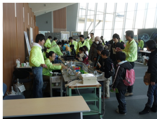
おもしろ科学教室（磁気浮上列車）