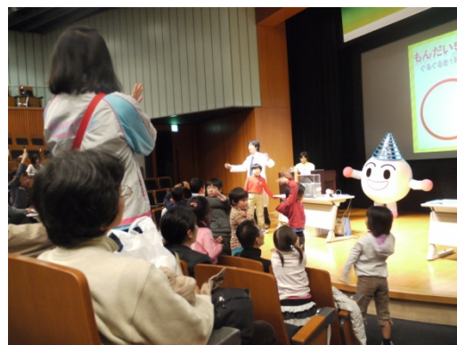
家族向け科学イベント（クイズ大会）