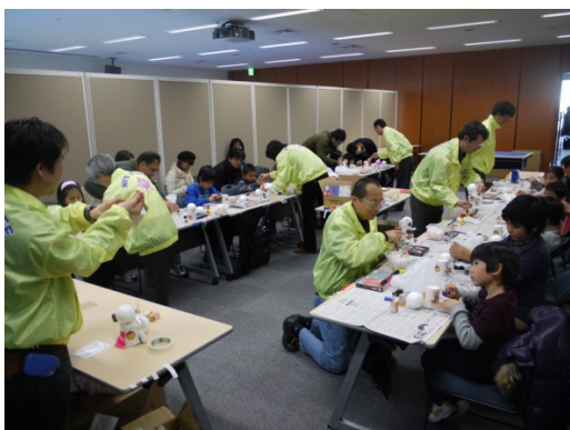
科学工作教室（ロボット工作）