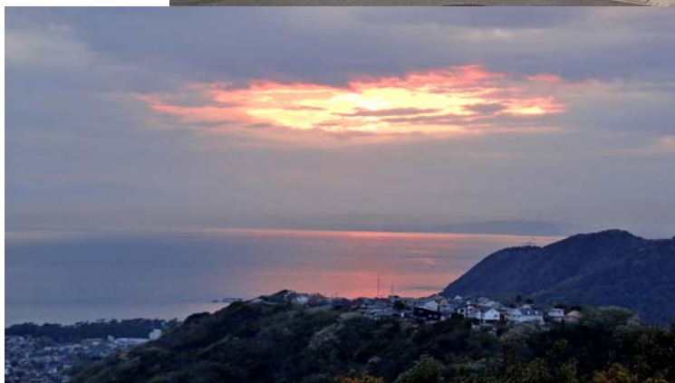
先導研屋上からの眺め

◎各専攻で教員や学生がメディアに出演が決まっている場合や、発表や表彰等があった際にはご連絡ください。またメディア等に出演される場合は、可能な限り「総合研究大学院大学」と表記していただけますようご協力お願いします。