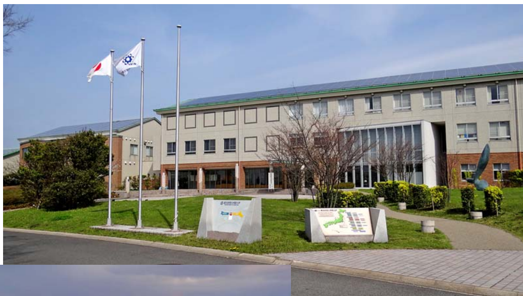
葉山キャンパスの風景

また、入学式の後の 1 泊 2 日の学生セミナーでは、学生の皆さまと教員の皆さまの交流が深められたものと思っております。