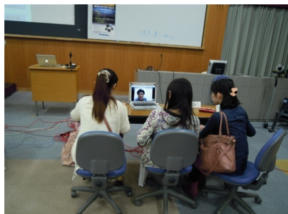
ハワイからも skype で接続して対応