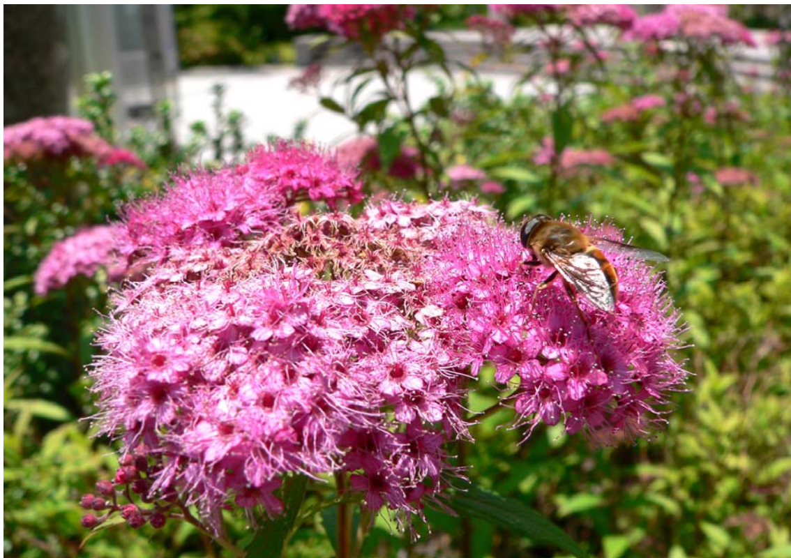
写真：ミツバチと下野（しもつけ）

最近の人事異動は7月に行われることが多いようです。歓送迎会が続くと思われませんが、飲み過ぎには注意しましょう。