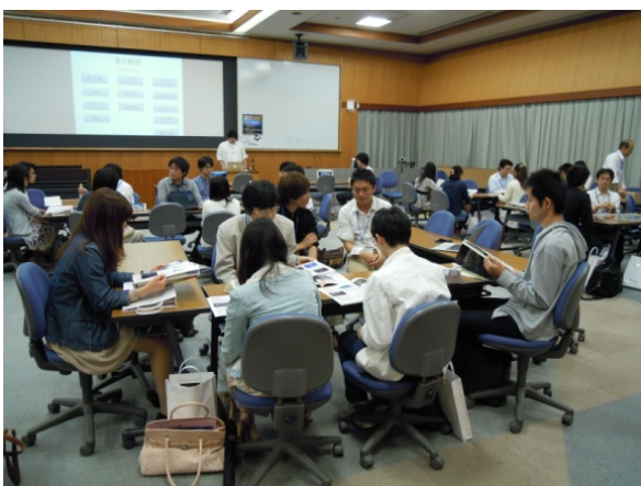
教員との相談会の様子