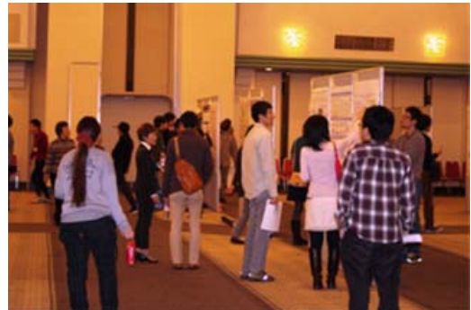
ポスターセッションの様子

普段接する事のない他専攻の学生や教員に自分の研究を説明する事は、発表者自身の研究に新しい視点からの提案を受けるだけでなく、自分の研究をより広い視野で捉える絶好の機会となりました。