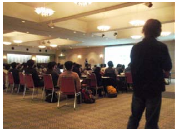
プレポスターセッションの様子