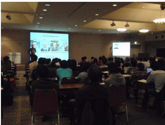
講演を聞く参加者