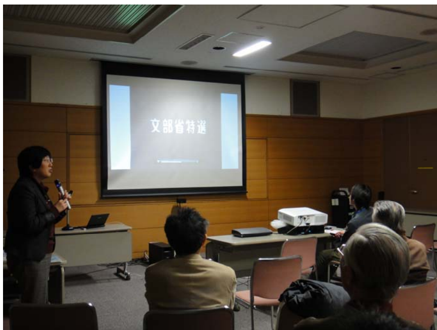
【文責：学融合推進センター 助教 村尾静二】

このような意見や感想を参考にしながら、これからも学内外において学術映像の上映会、研究会を継続して開催していきたいと思えます。