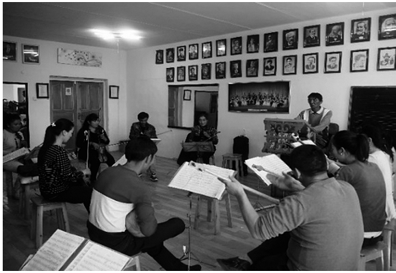
写真7 楽器クラスの練習風景