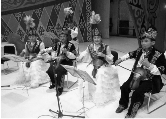
写真6 プリマ・コブズ