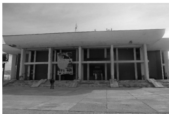
写真2 バヤンウルギー県音楽ドラマ劇場