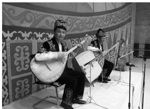
写真5 バス・ドンブラ (左) コントラバス・ドンブラ (右)