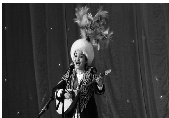
写真3 舞台上でのドンブラ演奏

このオーケストラでドンブラは、西洋のオーケストラにおけるトロンボーンやクラリネットといった、他のメロディーを飾り立てるための役割を果たしているという (Ajghaliev 2006: 7)。一方で、ドンブラの器楽曲を演奏する際は、主旋律のメロディーを演奏している。また、ドンブラは、ナイロン弦であり、他の金属弦の改良楽器に比べて音量が小さいため、他の改良楽器よりも担当する団員数が多い。調弦は、上の弦 (第1弦) をD (レ)、下の弦 (第2弦) をG (ソ) に合わせて演奏する。