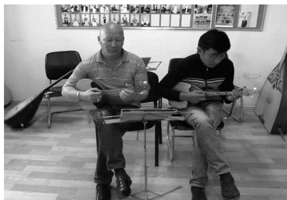
写真4 プリマ・ドンブラ

バス・ドンブラ (Kaz. bas-dombira : 写真5)、コントラバス・ドンブラ (Kaz. kontrabas-dombira : 写真5) は、プリマ・ドンブラと同じ金属弦と調弦 (第1弦: ミ、第2弦: ラ、第3弦: レ) となっている。しかし、バスとコントラバスとあるように、バス・ドンブラの音域が、コントラバス・ドンブラよりも高い。オーケストラ内では、伴