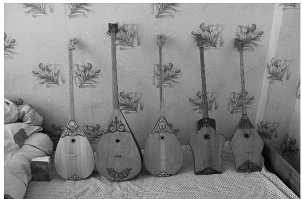
写真1 ドンブラの種類(右2つがダイヤ型のドンブラ、左3つが卵型のドンブラ)

この遊牧と移動を基礎に生活をしてきたカザフ人は、その生業を反映させた音楽文化を伝えてきた。ドンブラ(Kaz. dombira : 写真1)という卵型の胴と竿を合体させた2弦の撥弦楽器の演奏は、宴でのみならず日常生活でも活発に行われ