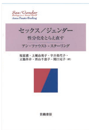
セックス／ジェンダー 性分化をとらえ直す アン・ファウスト-スターリング 著 福富護／上瀬由美子／宇井美代子／立脇洋介／ 西山千恵子／関口元子 訳 四六判 2200円 世織書房 2018年

続いて歴史分野から。隠岐さや香『文系と理系はなぜ分かれたのか』は、西欧の学術アカデミー黎明期や日本の近代化の過程まで遡り、学問がどのように編成されてきたかを探る本だ。第4章「ジェンダーと文系・理系」では、進路選択のジェンダー差と、いわゆる「理工系」分野に女性が少ないことをめぐる論点がもれなく簡潔にまとめられている。前章までの経緯を見れば、男性官僚中心の制度設計の中では「非