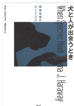
犬と人が出会うとき 異種協働のポリティクス ダナ・ハラウェイ 著 高橋さきの 訳 四六判 3600円 青土社 2013年