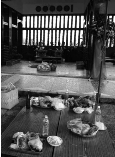
写真4 供物を並べている様子