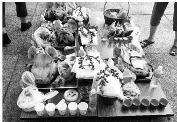
写真8 還願尾のために用意した供物

母に祈る人がいる一方で、「還願尾(Huanwanbue)」をおこなう人もいる。「還願尾」とは、前日に豚を献上した人びとの願いがかなえられたので、そのお礼として、豚の頭と尾、鶏、魚、マイ(甘口糯米)(全て加熱調理された)を用意して、家族全員で大公廨に参拝する儀礼である。