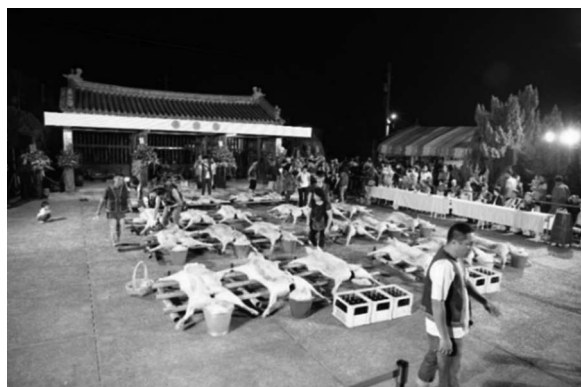
写真5 大公廨の前に並べられた供物と豚

CMH氏は手にI-hingを持って、運んできた豚を一頭一頭祓い清める。かつて、阿立母に捧げる豚は生きた雄であり、本祭で屠るという慣習があった。この時には、豚を屠る前に清めのために主祭の担当者は豚の口に米酒を入れていた。