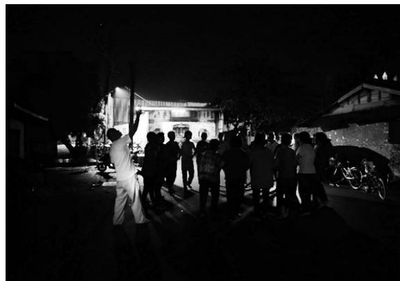
写真3 東南公廨前で牽曲する様子

集落内に回して牽曲するに際しては、それぞれの公廨の近隣に住んでいる住民がその年の牽曲の歌を聞くことができるようになっていた。