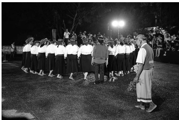
写真7 2016年夜祭の牽曲

れる。これらには、身の安全を守る力があるとされていた。現在の牽曲用の服は、紫色の頭巾、白い上着、紫色の帯、黒いスカートで構成される。かつてのシラヤ人はよく白い服を着ていたという理由から、白が基調となっている。この服は大公廨管理委員会の経費で服を製作する業者に頼んで作られた。村の公共財産となっており、夜祭のおよそ1週間前から参加者に配布される。