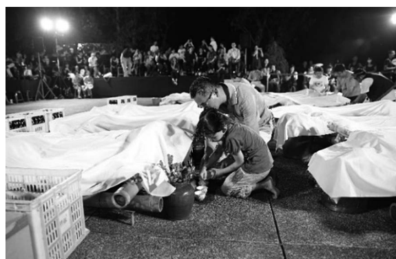
写真6 拝豚の儀礼に際した児童の献酒

続いて、「点豚（diyamdi）」 63 がおこなわれる。CMH氏は「尙祖枋 64 」とI-hingで豚の体を払い、呪文を唱えながら実のついている檳榔の枝を壺に差し込む。「点豚」がされた豚を他の神や幽霊に食べさせないように、助手は豚の上に白い布を置き、豚を覆っておく。その後、豚を献上す