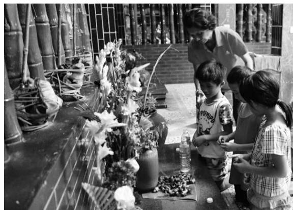
写真2 牽曲を練習する前に児童が三向をする様子

毎回、練習が始まる時には、男性の祭司であるCMH氏が、開向の儀礼をおこなう必要がある