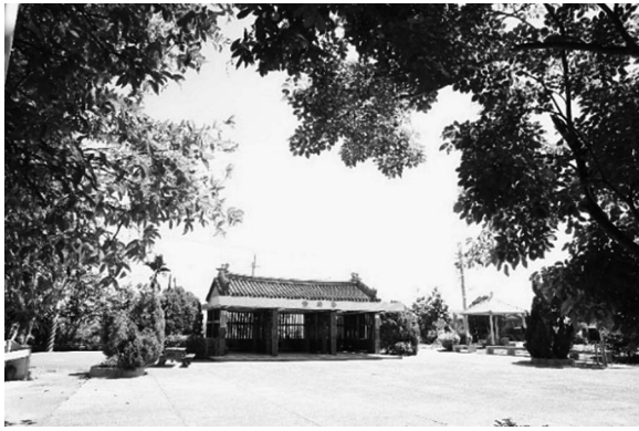
写真1 吉貝要集落の大公廨

も重要な行事として扱われる（段 2013b: 204-205）。なぜならば、夜祭の日は年に一度信者たちは家族全員ともに大公廨へ参拝しに行くことになっているからである。また、特別な理由をもって阿立母に祈願した人たちが、阿立母に感謝するために、次章に説明するように供物を豚一頭を始め、檳榔と米酒などの供物を用意して阿立母に献納する。集落出身のほとんどの人は何らかの形で参加する。出稼ぎで県外や海外で暮らす人、進学のため県外に在住する人や兵役に服する人も含めて、祭りの前に、もしくは祭り当日に集落に戻って、家族全員で阿立母を祀る。